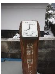
京都一周トレイル道標