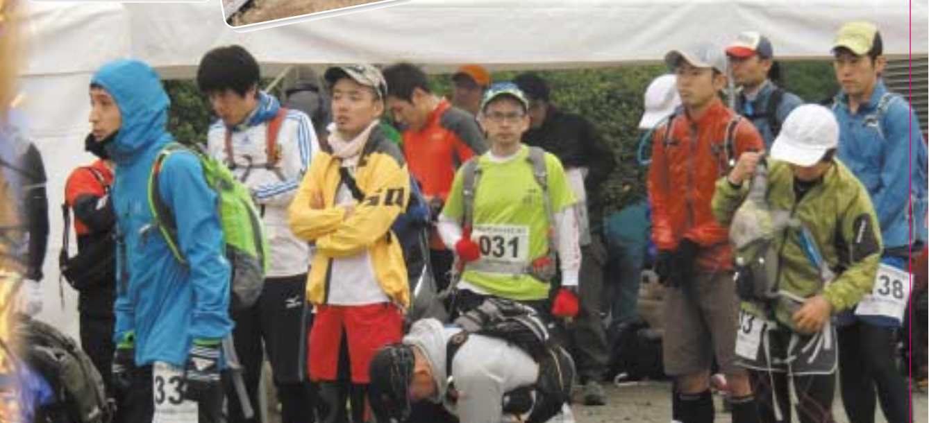
ダイヤモンドトレール 高低差

1968年大阪府と奈良県が整備したダイヤモンドトレール。北は屯鶴峰(どんづるぼう)から南は槇尾山までの全長約45kmが自然歩道となっています。今回は二上山から紀見峠まで起伏に富んだ関西屈指のコースを駆け抜けましょう。