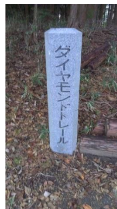
ダイヤモンドトレール標識