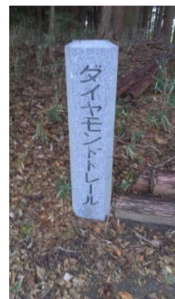
ダイヤモンドトレール標識